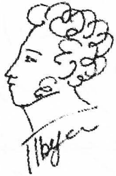
Рис. Т. Бусыревой.